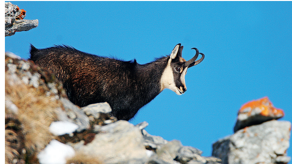
Gämsen sichtet man auf Aeugsten oft.