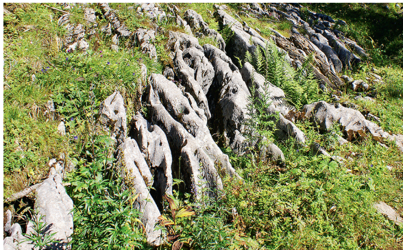
Karren zeigen kalkhaltiges Gestein an.

Schau dich gut um. Siehst du die verschiedenen Alter des Waldes? Baumkeimlinge, zarte Jungbäumchen, ausgewachsene Bäume, gestorbene Bäume. Berühre einen Totholzbaum oder -strunk vom Weg aus. Je älter das tote Holz, desto weicher und brüchiger ist es. Insekten, Pilze und Bakterien helfen, dieses zu zersetzen. So wird der Baum am Ende wieder als Erde dem Boden zurückgegeben.