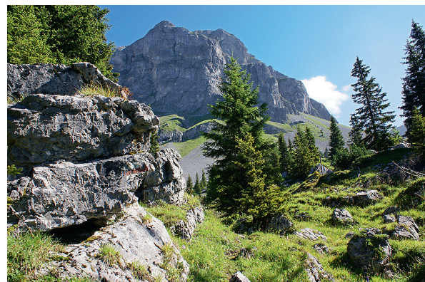
Blick zu den Schiltrisenen. Wo sind die Gämsen?

Nach dem Stein mit der roten Schrift «Alp Beglingen» betritt man ein tierisches Paradies: die Beglinger Gand. Zwischen Blockschutt und Sträuchern finden Gämsen, Rothirsche, Birkhühner und Co. beste Verstecke und Nahrung. Damit das Gebiet weiterhin für die Tiere ein gutes Rückzugsgebiet bleibt: Bitte Weg nicht verlassen und nicht lärmern.