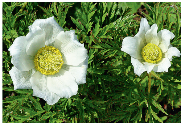
Die Alpenanemone wächst auf kalkreichen Böden.

Mit etwas Glück kann man bei der Talstation der Aeugstenbahn (Südseite der Station) einer spektakulären Heulandung zuschauen. Ein Heuseil endet dort. Aus Sicherheitsgründen muss man unbedingt gebührend Abstand zum Landeplatz halten.